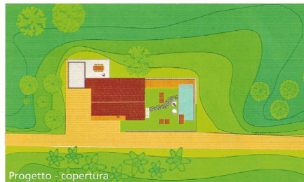
Progetto - copertura