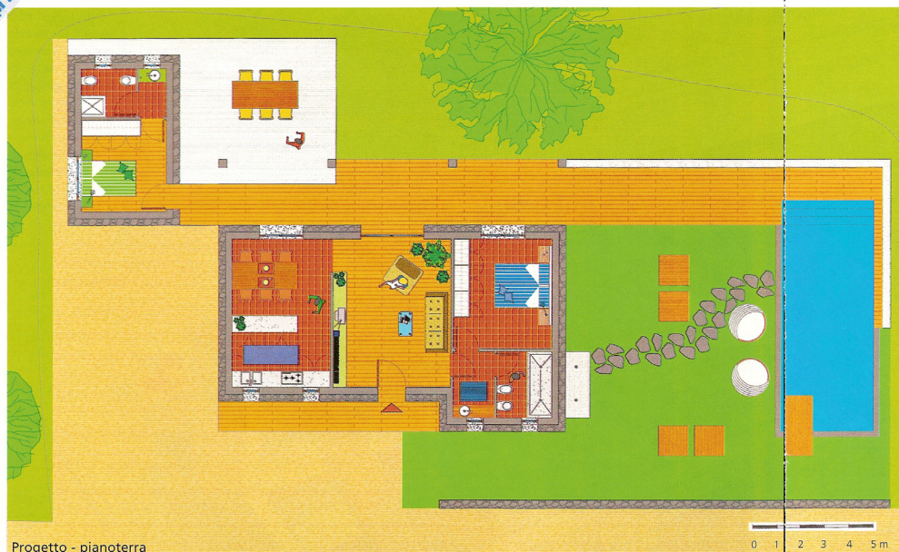
Progetto - pianoterra