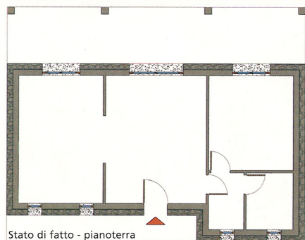
Stato di fatto - pianoterra

Nelle planimetrie a sinistra e sopra, e nelle foto qui a destra, lo stazzo scelto per il progetto architettonico di Dove. È nell'entroterra di San Pantaleo; in fase di ristrutturazione, si vende per 380.000 € nelle condizioni attuali mentre, una volta completato, il prezzo sarà di 450.000 €. È senz'altro conveniente acquistarlo finito. Il rustico, rinforzato all'interno, viene rivestito con le pietre dell'edificio originale. Lo si valorizza molto realizzando una piscina, anche se l'immobile è a soli dieci minuti d'auto dalle spiagge della Costa Smeralda.